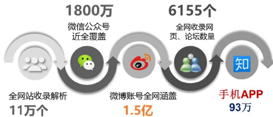
图 1 基础大数据库的情况简介